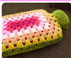
おしゃれなゆたんぼカバーもかわいいですね♡

リラックスな一人時間、何か物作りに挑戦したいと思ったら、是非編み物を始めませんか？ 優しい講師がマンツーマンで、丁寧に教えてくださいます♪ ハンドメイドは一生の 宝物 ♪♪皆様のお越しを、お待ちしております。